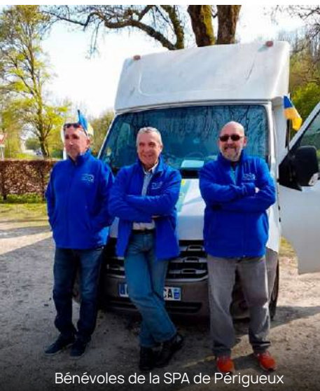
Bénévoles de la SPA de Périgueux

Aussitôt arrivées, les denrées ont été rechargées dans un autre convoi, le soir même, puis acheminées à Marioupol le lendemain matin.